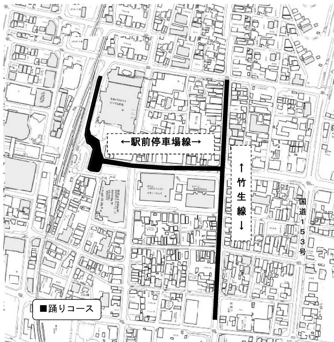
おいでんファイナル会場図（案）